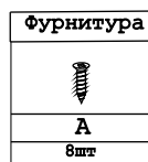
Схема сборки брифинга V-891, V-892